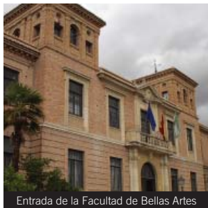
Entrada de la Facultad de Bellas Artes

Líneas: Acceso al Campus de Aynadamar: N2, U1 y N3, 111 (paradas cercanas en Rotonda Europa).