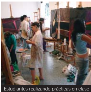
Estudiantes realizando prácticas en clase