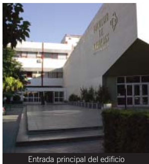
Entrada principal del edificio