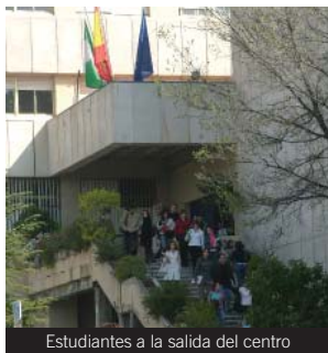
Estudiantes a la salida del centro