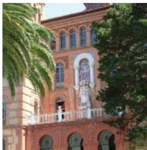
Fachada del Colegio Máximo de Cartuja

Líneas: Acceso al Campus de Cartuja: U1, U2 y U3.