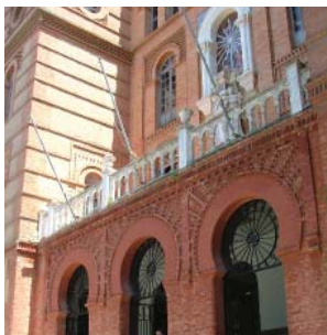
Entrada de la Facultad de Odontología