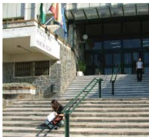
Entrada de la Facultad de Psicología

Líneas: Acceso al Campus de Cartuja: U1, U2 y U3.