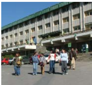
Estudiantes saliendo del centro