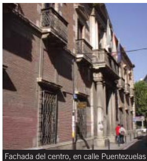
Fachada del centro, en calle Puentezuelas