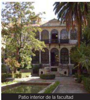
Patio interior de la facultad