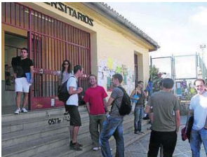
Entrada del comedor de Fuentenueva