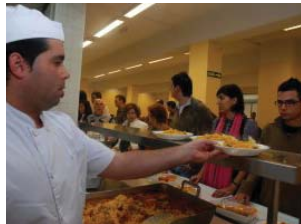
Estudiantes en el interior de los comedores