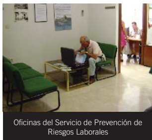
Oficinas del Servicio de Prevención de Riesgos Laborales