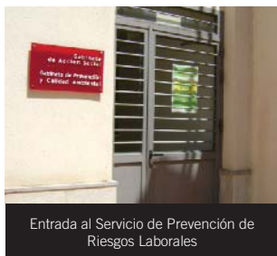
Entrada al Servicio de Prevención de Riesgos Laborales