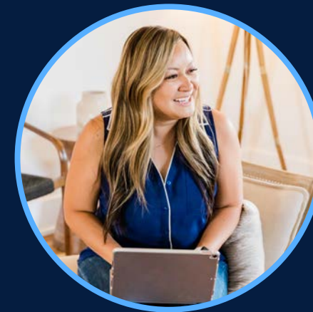
Blanca Cortés Diseño web